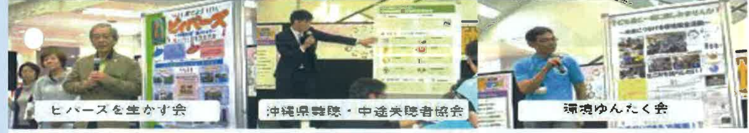
ヒバースを生かす会