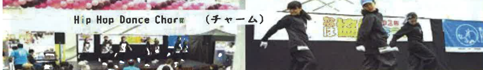
Hip Hop Dance Chora (チャーム)