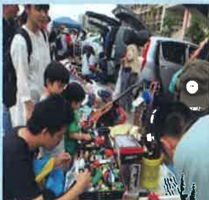
那覇市緑化センターの様子