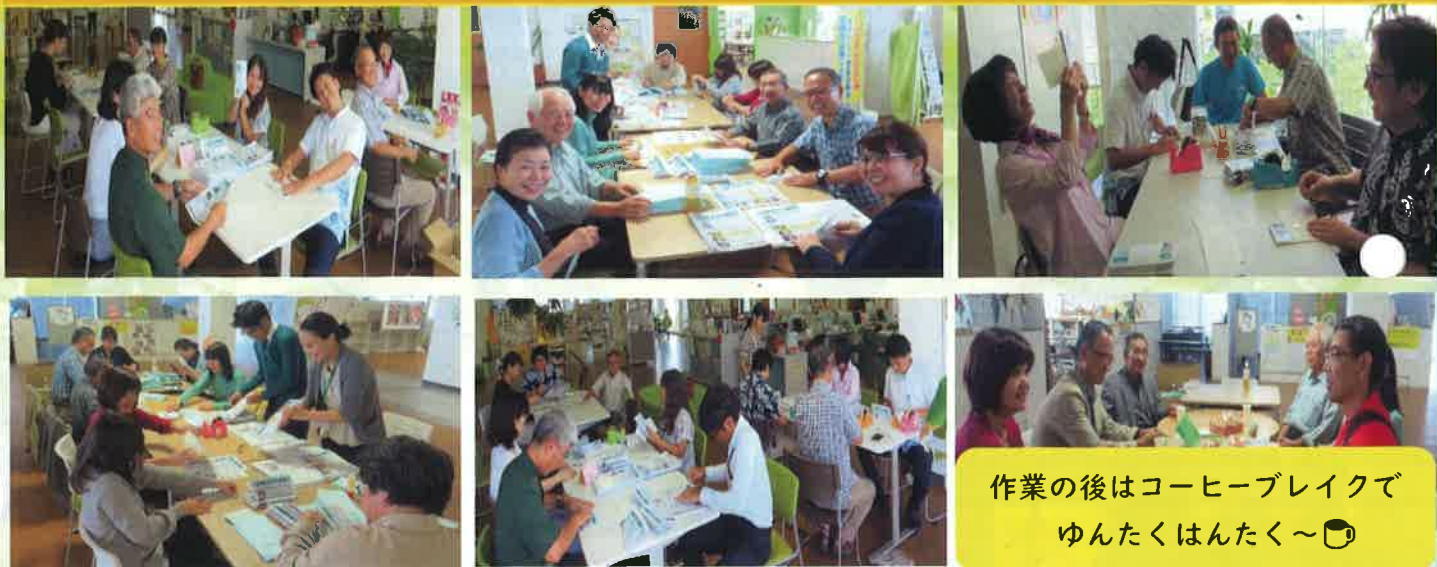
作業の後はコーヒブレイクで ゆんたくはんたく～☺

協働大使の皆様のお手元に届く協働通信の発送作業も皆様に多大なるご協力頂いております。繁忙期にも関わらず、笑顔で♪600枚ほどの通信を手作業で1枚1枚折込してお送りしております。1人でやればしんどい作業も皆でやれば笑顔もあふれ、ゆんたくはんたくしながら♪あっという間に終わります。H29年度もみな様、ありがとうございます！深く感謝♡感謝です、(^^)♪