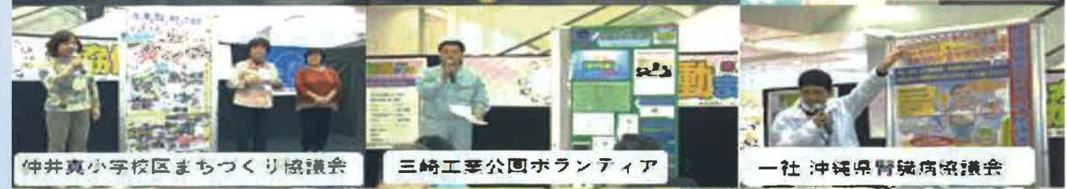
仲井真小学校区まちづくり協議会