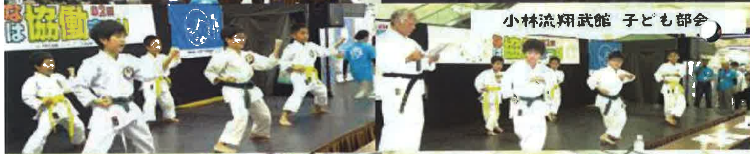
小林流翔武館 子ども部会