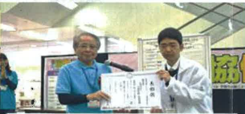
優秀賞 / 協議会会長賞 沖縄県腎臓病協議会