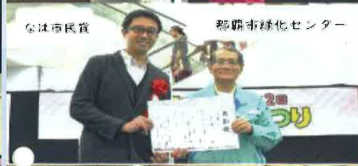
なは市民賞 那覇市緑化センター