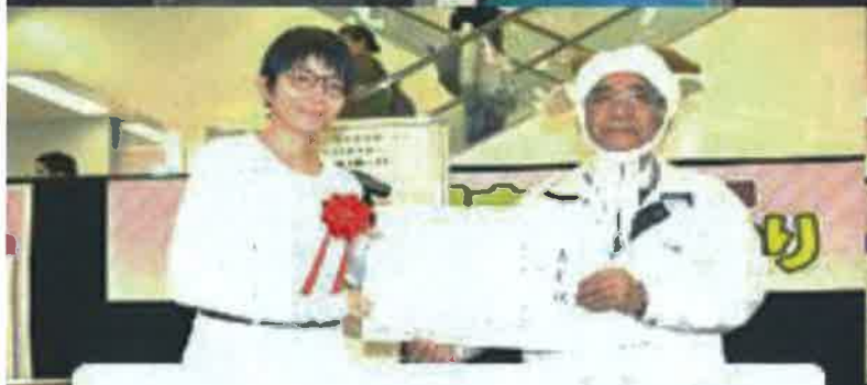
アイデア賞 大石公園まちづくり委員会