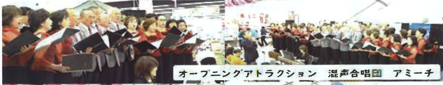
オープニングアトラクション 混声合唱団 アミーチ