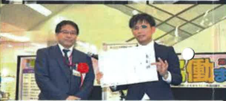
イオン琉球賞 沖縄県聴覚・中途失聴者協会