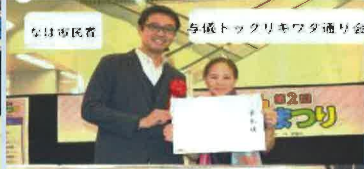
なは市民賞 与儀トックリキワタ通り会