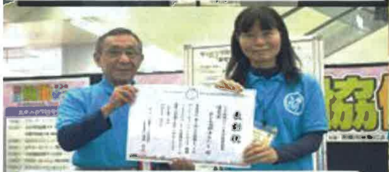
優秀賞 / 実行委員長賞 子ども分野ゆんたく会