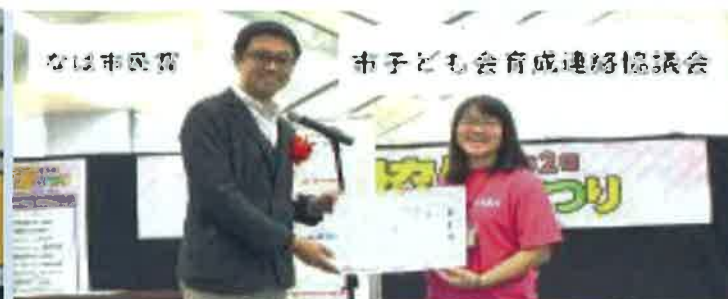
なは市民賞 市子ども会育成連絡協議会