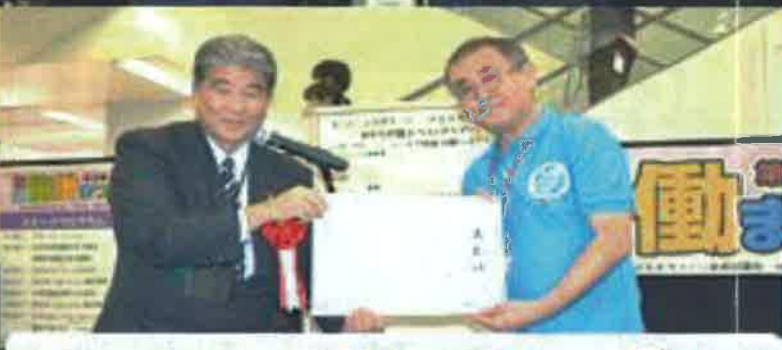
優良賞 (代表して) 与儀小学校区まちづくり協議会