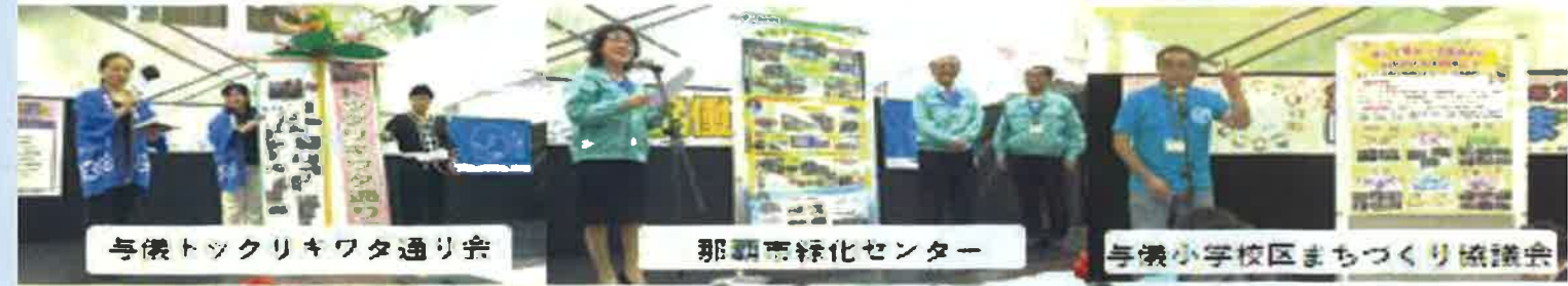
与儀トックリキワタ通り会