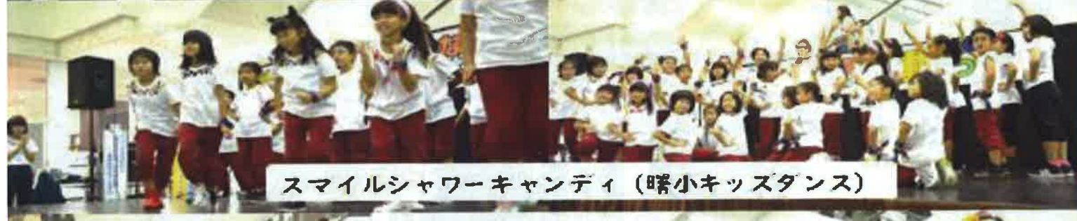
スマイルシャワーキャンディ (曙小キッズダンス)