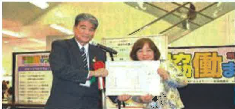
優秀賞 / 那覇市長賞 仲井真小学校区まちづくり協議会