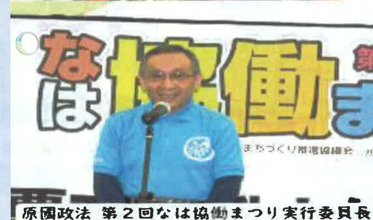
原國政法 第2回なは協働まつり実行委員長