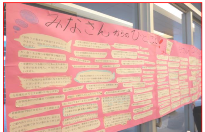
たくさんコメントありがとうございました！