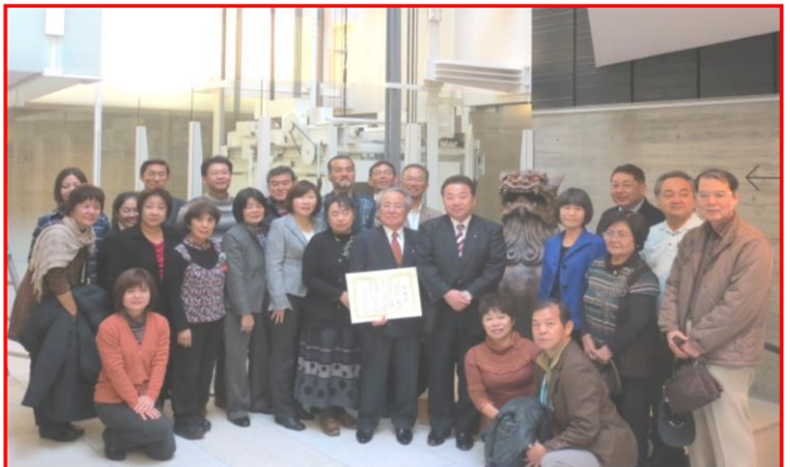
シーサープロジェクト（7月～11月）