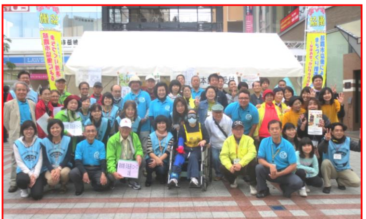
協働まつり な～ふぁぬわ（2/9）