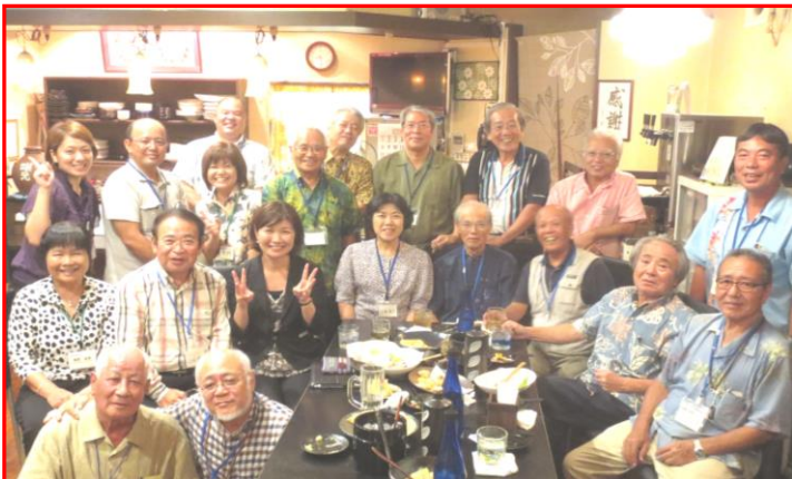
地域ゆんたく会（9/25 松城中）

各専門部会、ゆんたく会、大石公園CGG、シーサープロジェクト、協働まつり な～ふぁぬわ、大ゆんたく会（残念ながら、台風の為中止になりました・・・）など、様々な取り組みができた、大変充実した年度となりました。今年度のつながりを平成 26 年度も継続し、さらなる協働の輪の広がりを期待して、これからも大使のみなさまと様々な協働事業を展開できればと思っております。合言葉は、“な～ふぁぬわ”！