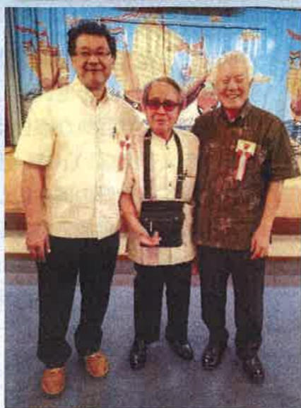
銘苅会長と一緒に